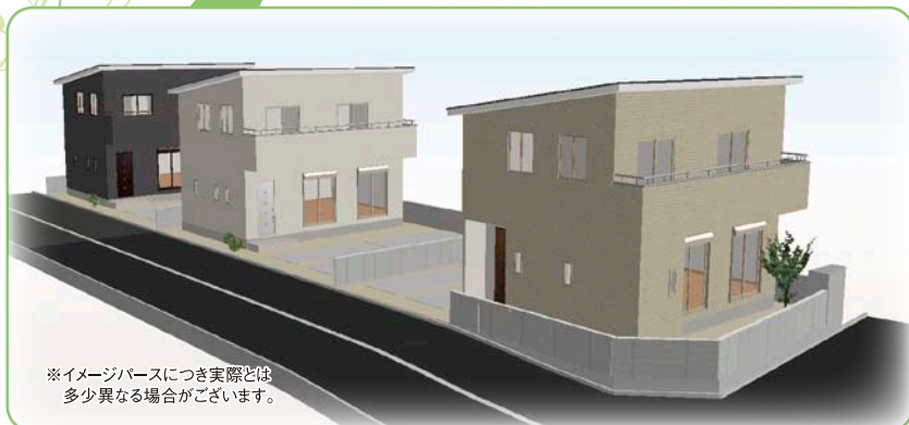
※イメージベースにつき実際とは多少異なる場合がございます。