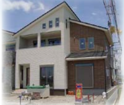
【勝瑞モデルハウス1号地】 ※平成30年6月完成