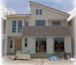
【勝瑞モデルハウス2号地】 ※平成30年7月完成予定