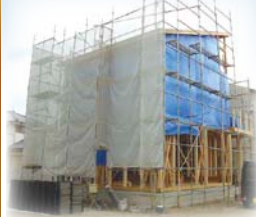
【奥野モデルハウス6号地】 ※平成30年9月完成予定