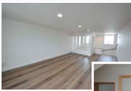
収納力たっぷりの 小屋裏収納！