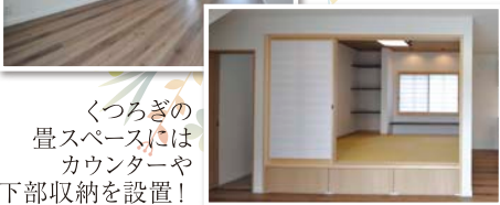
くつろぎの 畳スペースには カウンターや 下部収納を設置！