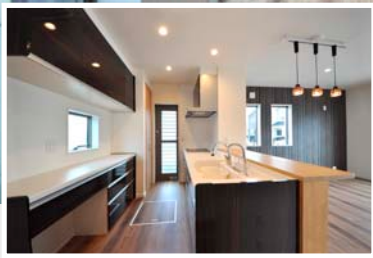
キッチンにはタッチレス水栓& 浄水器付き♪