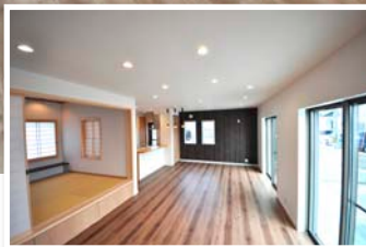
家族が集まるリビングは広々19.96帖！