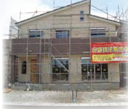
【勝瑞モデルハウス3号地】 ※平成30年7月完成予定