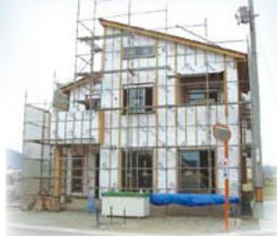
【勝瑞モデルハウス8号地】 ※平成30年9月完成予定