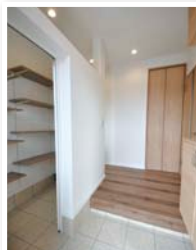
あったら便利な 玄関収納♪